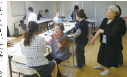
たわいないおしゃべりもサロンの楽しみ

①まず資金面では当面は参加費を集めることで乗り切り、社協の「ふれあい・いきいきサロン事業」登録によって半年後には助成金が得られたことからなんとか安定できました。②会場確保では団地集会所を当てることでできたほか、自治会の協力で無料で使用できて費用も節約。③毎月企画テーマ選定も難題。どんな内容なら参加者を増やせるか、満足してもらえるか。住宅管理公社のサロン活動への講師派遣事業を利用したり、社協に助言を求めたり、今でも悩みながら進めています。