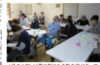
6月のサロンは夏に気になる熱中症がテーマ

始めの一歩はたいへんですが、踏み出せば必ず道は開けます。「サロンななかまど」の場合も仲間と周囲からの支援が集まり、活動も軌道に乗り始めています。