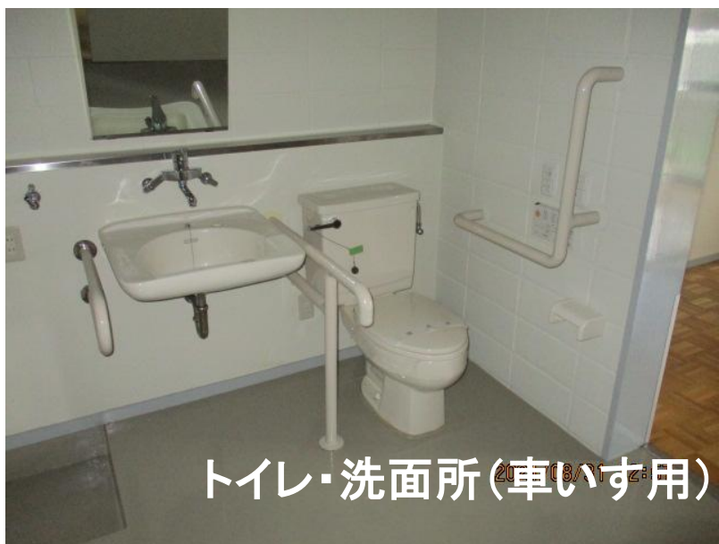
トイレ・洗面所(車いす用)