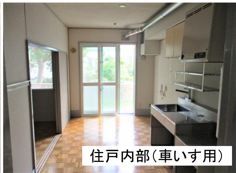
住戸内部(車いす用)